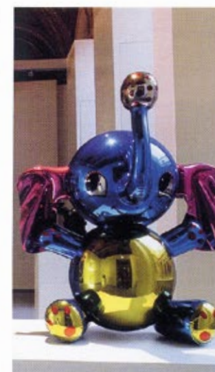
Jeff Koons, Elephant (2003). Collection Pinault, Palazzo Grassi, Venise.