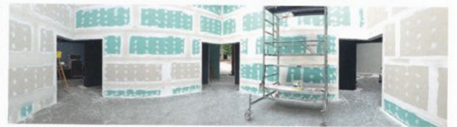
9 | 7. Mai 2014