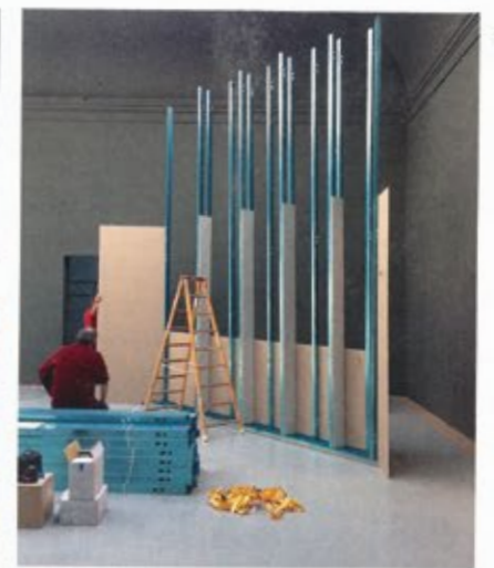
7 | 29. April 2014