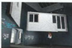
3 | Fertigteilelemente