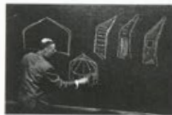
2 | Jean Prouvé