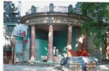
10 | 9. Mai 2014