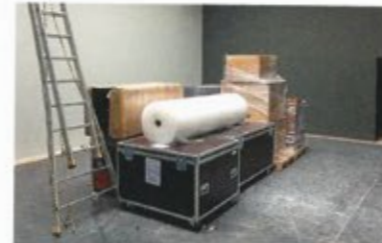
8 | 7. Mai 2014