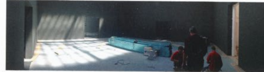
5 | 29. April 2014

Und spielt die Moderne in der französischen Architektur heute eine Rolle? Gibt es überhaupt noch eine spezifisch französische Architektur? Ich glaube nicht, dass es im Augenblick eine französische Architektur gibt. Sie kann von Franzosen oder anderen Architekten entworfen werden. Für mich ist dieses „Spannungsfeld Frankreich“ durch drei Faktoren charakterisiert: Erstens ein „konstruktives Temperament“. Sigfried Giedion hat schon 1928 die französischen Eisenskelettbauten des 19. Jahrhunderts als Vorläufer der modernen Architektur beschrieben. Der