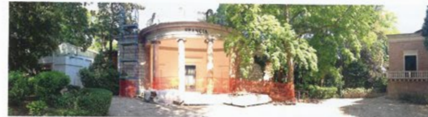
6 | 29. April 2014