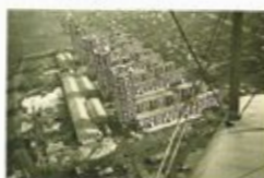
4 | Drancy

Tiere wie in einem Zoo gezeigt. Nun könnte es zum ersten Mal mehr wie ein Chor oder Orchester aussehen.